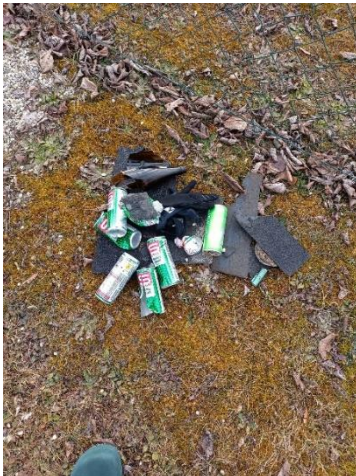
Müll beim Spielplatz in Kirchdorf/Inn.