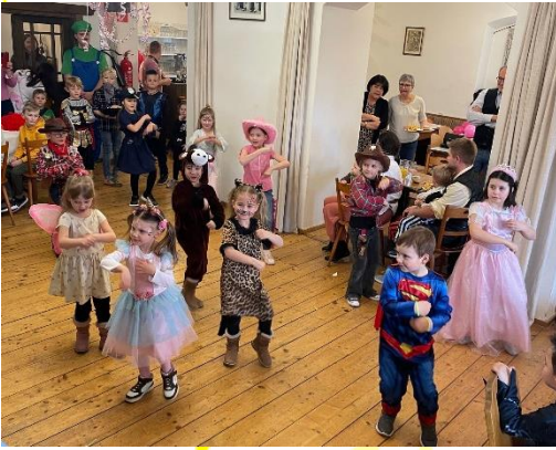
Die Kinder hatten eine große Freude beim Kinderfasching im GH Schlosstaverne in Katzenberg. Organisiert vom Elternverein.