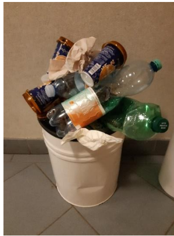
Müll vor dem Eingang in die Mehrzweckhalle!