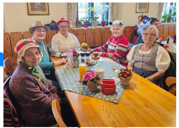
Faschingsfeier der Senioren, mit Schlagerparade in Katzenberg.