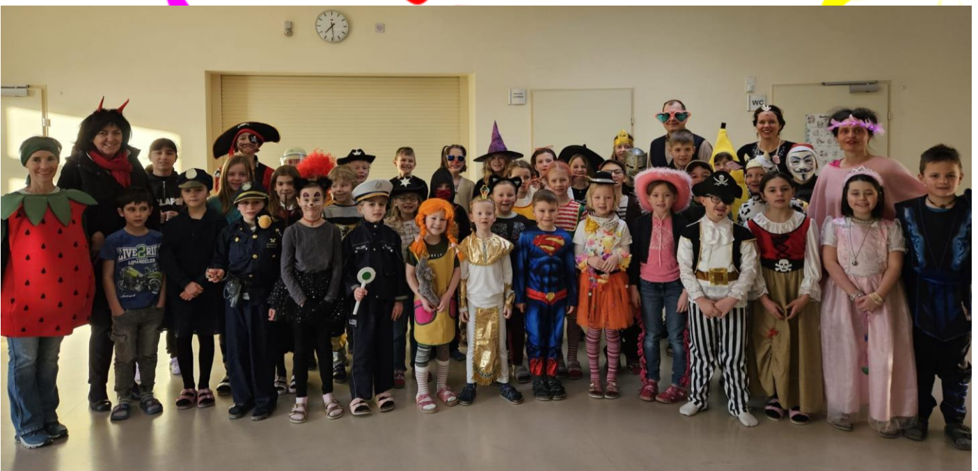
Bei den Volksschulkindern in Mühlheim, Kooperation Kirchdorf – Mühlheim wurde am Faschingsdienstag der Faschingsausklang gefeiert. Dazu gab es Faschingskrapfen.