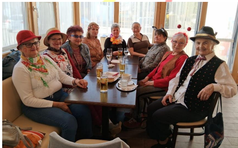
Die Goldhaubenfrauen hielten ihr Faschingskränzchen beim Sparmarkt in Katzenberg ab.